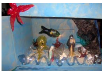
Classe 3 a B sez. primaria

Il 18 dicembre alle ore 16.00 la nostra scuola ha offerto al territorio una testimonianza natalizia per ricordare le nostre radici cristiane e che Dio nasce per ciascuno di noi. È stato un invito a riflettere sul Creato: la terra, il mare, gli esseri viventi.